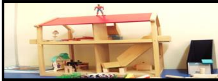
Gambar 6. Sesi terapi bermain sampel 6

Gambar 5 menunjukkan klien memainkan permainan mengenai peperangan untuk mempertahankan barang bernilai seperti piala dan motosikal. Telefon bimbit pula disimbolikan sebagai iphone yang ingin dimiliki suatu hari nanti. Piala tersebut disimbolikan oleh klien sebagai anugerah yang pernah dimiliki suatu ketika dahulu. Manakala, motorsikal pula merujuk kepada motorsikal kepunyaan abang yang telah meninggal dunia dalam kemalangan langgar lari. Menurut klien, askar tersebut berperang untuk mempertahankan motorsikal kepunyaan abang daripada dijual.