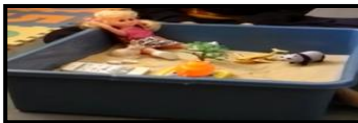
Gambar 13. Sesi terapi bermain sampel 13

Gambar 12 menunjukkan klien bermain tentang sebuah keluarga yang mempunyai bapa, ibu dan dua orang anak. Dalam keluarga tersebut, bapa jarang berada di rumah kerana sibuk bekerja. Hanya sekali sekala bapa ada untuk makan bersama satu keluarga.