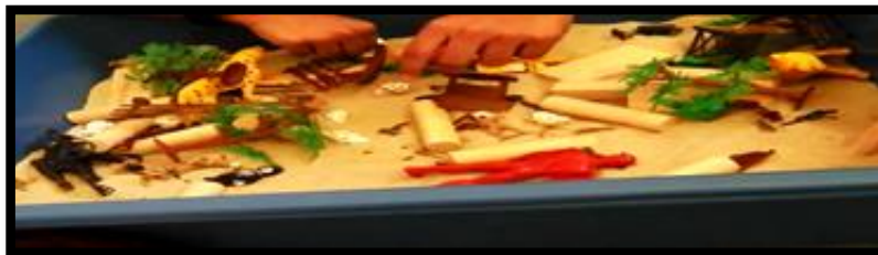
Gambar 4. Sesi terapi bermain sampel 4

Gambar 3 menunjukkan klien pada mulanya bermain dengan blok kayu di dalam sesi. Klien membina sebuah rumah kecil, dan kemudian memusnahkannya. Selepas itu, klien mengambil kertas lukisan dan melukis gambar sebuah rumah dengan dua batang pokok. Klien ada menyatakan bahawa rumah yang dilukis kosong, kerana tiada orang.