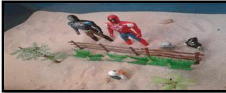
Gambar 14. Sesi terapi bermain sampel 14

Gambar 14 menunjukkan klien memainkan permainan tentang isu perkauman di mana klien telah mensymbolikkan patung orang yang kecil berwarna putih sebagai dirinya. Di dalam permainan tersebut, klien telah meletakkan pagar sebagai pembahagi di antara patung orang berwarna putih dengan pihak di seberang pagar. Spiderman berwarna merah dan hitam disymbolikkan sebagai kawan satu sekolah yang sangat berpengaruh yang sering mengejek dan membuli klien kerana berbangsa India. Manakala patung orang berwarna kelabu dan hitam pula disymbolikkan sebagai rakan sekelas klien yang juga tidak mahu berkawan dengan klien.