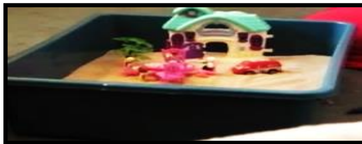
Gambar 12. Sesi terapi bermain sampel 12

Gambar 12 menunjukkan klien bermain tentang sebuah keluarga yang mempunyai bapa, ibu dan dua orang anak. Dalam keluarga tersebut, bapa jarang berada di rumah kerana sibuk bekerja. Hanya sekali sekala bapa ada untuk makan bersama satu keluarga.