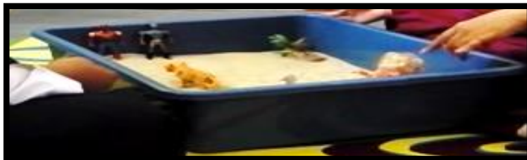
Gambar 7. Sesi terapi bermain sampel 7

Gambar 6 menunjukkan klien telah bermain dengan tema yang berkaitan dengan keselamatan di rumah. Klien selalu bimbang kerana sering kali berlaku perkara mistik di dalam rumah. Berdasarkan gambar di atas, klien mensimbolkan Spiderman hitam sebagai lembaga yang sering melintas di kawasan dapur. Manakala, Spiderman merah yang berada di atas bumbung rumah pula, disimbolikan sebagai penyelamat yang mampu mengawal keadaan di dalam rumah.