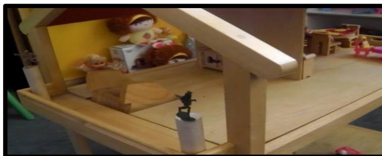
Gambar 16. Sesi terapi bermain sampel 16

Gambar 15 menunjukkan klien memainkan tentang keadaan persahabatan di antara tiga orang kawan baik. Klien mensymbolikkan anak patung perempuan di luar pagar sebagai diri klien yang selalu berhadapan dengan dua orang rakan yang disymbolikkan sebagai harimau dan harimau bintang yang sering bergaduh kerana ingin rapat dengan klien. Salah seorang daripada rakan tersebut yang disymbolikkan sebagai harimau bintang mempunyai personaliti yang sangat dominan dan manipulatif.