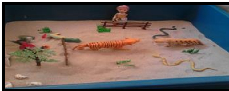
Gambar 15. Sesi terapi bermain sampel 15

Gambar 14 menunjukkan klien memainkan permainan tentang isu perkauman di mana klien telah mensymbolikkan patung orang yang kecil berwarna putih sebagai dirinya. Di dalam permainan tersebut, klien telah meletakkan pagar sebagai pembahagi di antara patung orang berwarna putih dengan pihak di seberang pagar. Spiderman berwarna merah dan hitam disymbolikkan sebagai kawan satu sekolah yang sangat berpengaruh yang sering mengejek dan membuli klien kerana berbangsa India. Manakala patung orang berwarna kelabu dan hitam pula disymbolikkan sebagai rakan sekelas klien yang juga tidak mahu berkawan dengan klien.