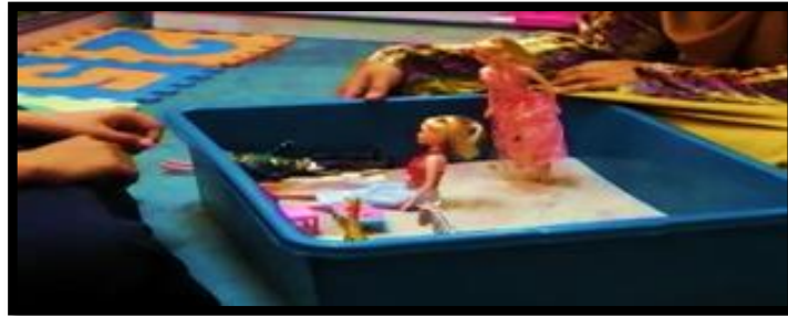
Gambar 11. Sesi terapi bermain sampel 11

jalan ke zoo negara bersama bapa suatu ketika dahulu semasa bapanya masih mampu berdiri dan berjalan.