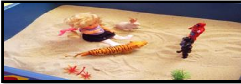
Gambar 2. Sesi terapi bermain sampel 2