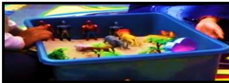
Gambar 1. Sesi terapi bermain sampel 1

Berdasarkan hasil sesi saringan terapi bermain, isu yang dapat dikenalpasti dialami oleh klien kanak-kanak di sekolah rendah adalah isu kekeluargaan seperti pengabaian, perhatian, hubungan adik-beradik, keselamatan, isu persahabatan seperti pergaduhan rakan sebaya dan juga isu perkauman seperti dipulaukan dan diejek oleh rakan yang berlainan bangsa. Majoritinya iaitu seramai 14 orang (70%) klien kanak-kanak yang menjalani sesi saringan terapi bermain mempunyai isu dan permasalahan yang berkaitan dengan keluarga dan rakan sebaya. Gambar 1 sehingga gambar 16 menunjukkan gambaran dengan lebih jelas perkaitan di antara kategori alat permainan yang dipilih, tema bermain dan isu yang dialami oleh klien kanak-kanak.