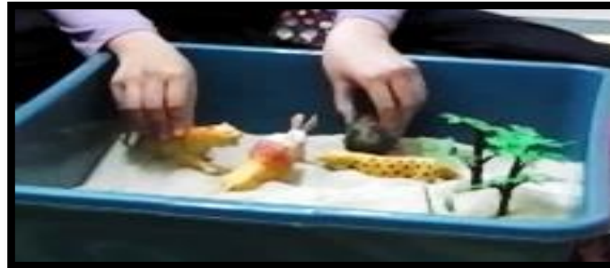
Gambar 9. Sesi terapi bermain sampel 9

Gambar 8 menunjukkan klien memainkan situasi di rumah semasa waktu makan. Klien mensymbolikkan katak kuning sebagai ayah, kala jengking sebagai ibu, katak coklat sebagai adik lelaki dan katak biru sebagai adik perempuan. Manakala, diri klien disymbolikkan sebagai katak biru yang duduk berjauhan daripada ahli keluarga yang sedang makan bersama. Klien suka menghabiskan masa bermain dengan gajet sekiranya ahli keluarga sedang makan bersama. Klien kebiasaannya akan mengelakkan diri daripada menyertai aktiviti keluarga.