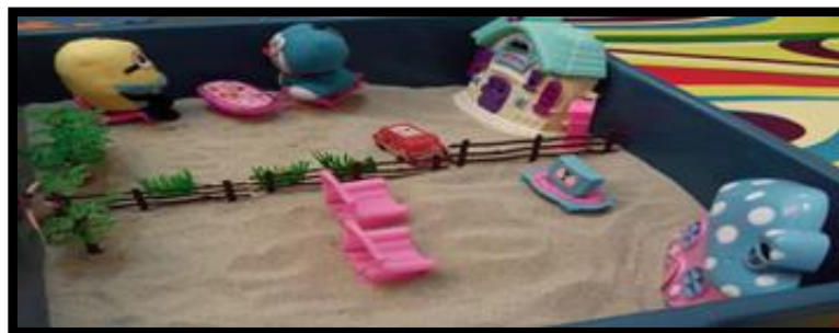
Gambar 10. Sesi terapi bermain sampel 10

Gambar 9 menunjukkan klien memainkan permainan yang berunsurkan pergaduhan. Merujuk gambar di atas, klien mensymbolikkan harimau, singa, dan harimau bintang sebagai kawan yang selalu mencetuskan pergaduhan. Manakala arnab pula disymbolikkan sebagai kawannya yang lemah dan tidak mampu untuk melawan. Badak pula disymbolikkan oleh klien sebagai dirinya yang hanya mampu melihat pergaduhan tersebut dari jauh.